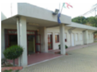
Il plesso Borgata di Caniga

accanto all'edificio della scuola dell'infanzia