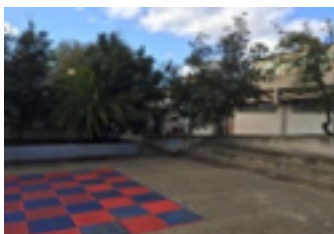
Il plesso di v. Forlanini, Rione Carbonazzi,

accanto all'edificio della scuola dell'infanzia