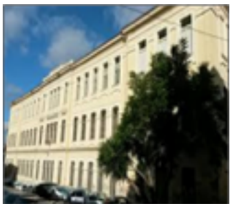
Il plesso San Donato Via Fontana, 3