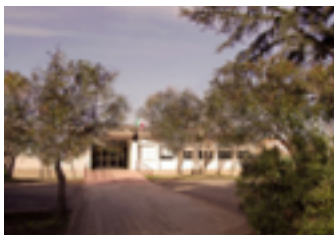
Il plesso Borgata di Bancali

accanto all'edificio della scuola dell'infanzia