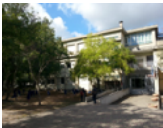
Il plesso Fabrizio de André Via Artiglieria con: classe Montessori, Scuola dell'Infanzia Scuola Secondaria di I grado